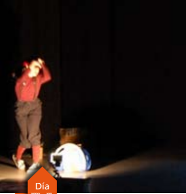
Ni fu ni fa animación