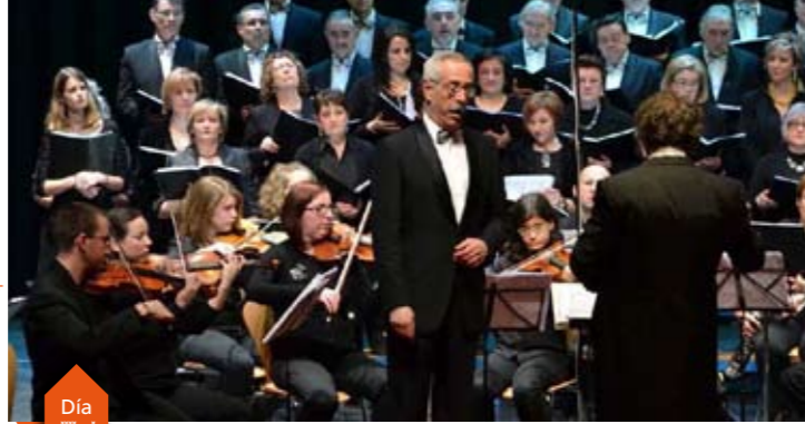
Coral polifónica do Hospital Xeral-Calde e orquestra clásica de Xove

·20.30 h. Igrexa a Nova BANDA MUNICIPAL DE LUGO ORFEÓN LUCENSE