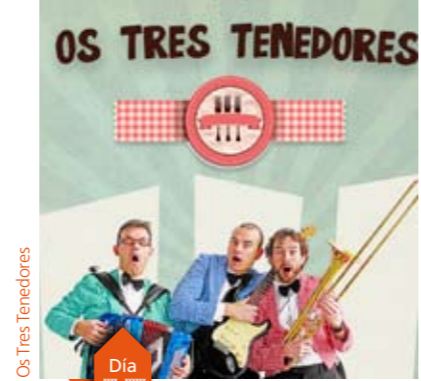
Os Tres Tenedores

·18.30 h. Auditorio Municipal Gustavo Freire 60'