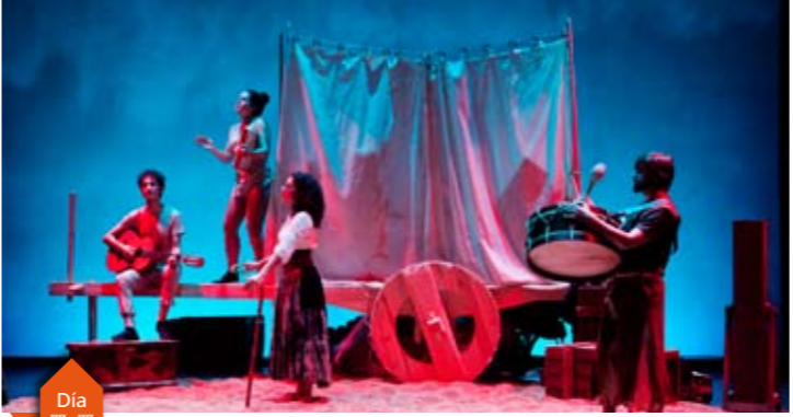
Grupo de teatro do colectivo cultural Ollomao - Barreiros

·17.00 h. Centro de dinamización rural de Rubiás CORO DA ASOCIACIÓN DE AMIGOS DO CAMIÑO DE SANTIAGO