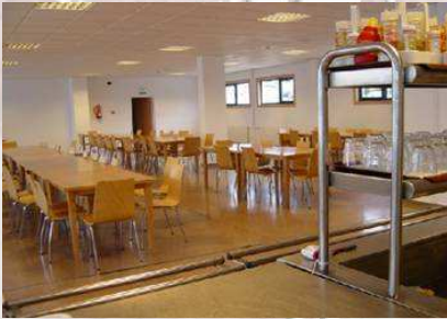
Comedor Residencia Abeiro