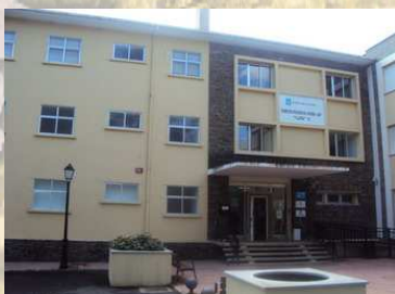
Alojamiento Albergue Juvenil Lug II