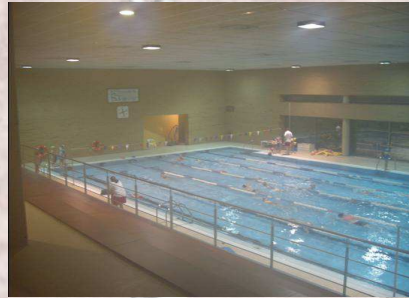
Piscina As Pedreiras