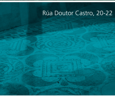
Rúa Doutor Castro, 20-22