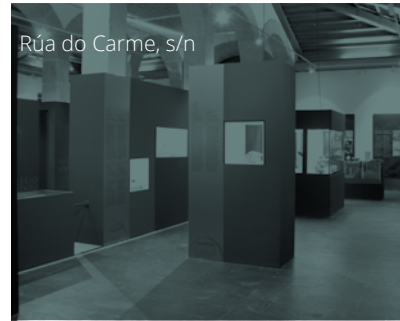
Rúa do Carme, s/n