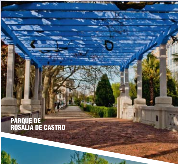
PARQUE DE ROSALÍA DE CASTRO