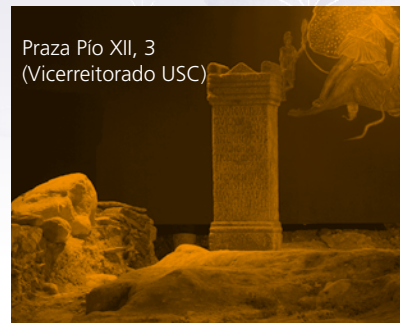
Praza Pío XII, 3 (Vicerreitorado USC)