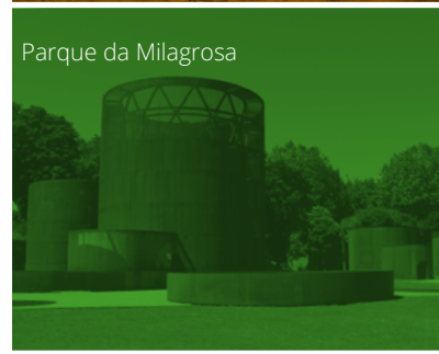
Parque da Milagrosa