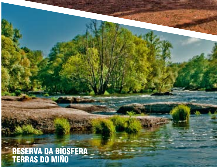
RESERVA DA BIOSFERA TERRAS DO MIÑO