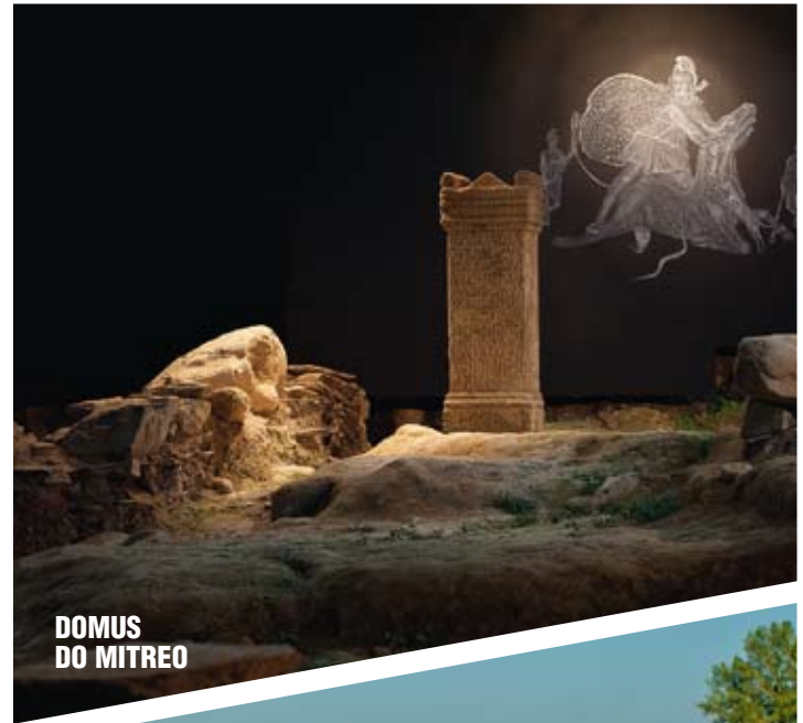
DOMUS DO MITREO

E non un só río. Ademais do Mera, o río dos muíños, á beira do cal hai unha ruta sinalada de sendeirismo, está o Rato ou Fervedeira, cun verdadeiro parque de varios quilómetros ás súas beiras, entre antigas carballeiras. Un magnífico paseo