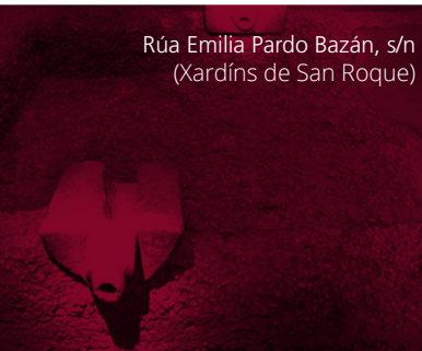
Rúa Emilia Pardo Bazán, s/n (Xardíns de San Roque)