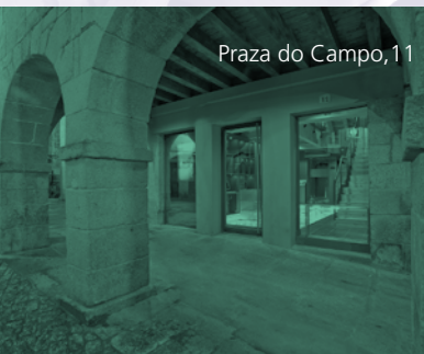
Praza do Campo, 11

Para máis información consultar na Oficina Municipal de Turismo (CIM), praza do Campo, 11. Telf.: 982 251 658. lugoturismo@concellodelugo.org