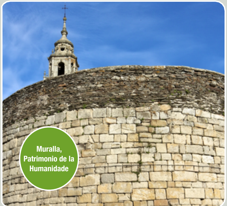
Muralla, Patrimonio de la Humanidad

Este pasado romano convive en armonía con el Lugo monumental que conserva importantes vestigios que se remontan a la época medieval. Imprescindibles resultan las visitas a Catedral de Lugo. Recién restaurada destaca el hallazgo de los frescos del maestro astorgano José de Tendirán y que datan de finales del siglo XVIII. Por el gran valor artístico y su belleza ya están considerados como un referente del barroco gallego y los medios rebautizaron con el nombre de "la Capilla Sixtina de Galicia".