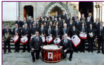
Banda Municipal de Guntín