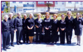
Schola Gregoriana Lucensis - Lugo