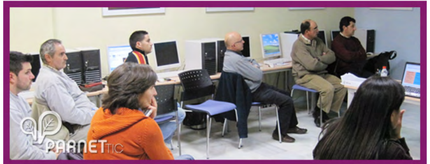
Sesión del taller

La sociedad de comercio actual exige de los empresarios un esfuerzo suplementario para colocarse en primera línea con las potencialidades de Internet, información en el acto para el cliente y tener un seguimiento del estado de la empresa automáticamente y en cada momento , para ello que mejor forma de hacerlo que con un dispositivo móvil de última generación.