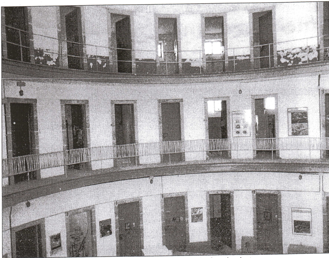
Detalles correspondentes ás celdas no interior do patio cuberto