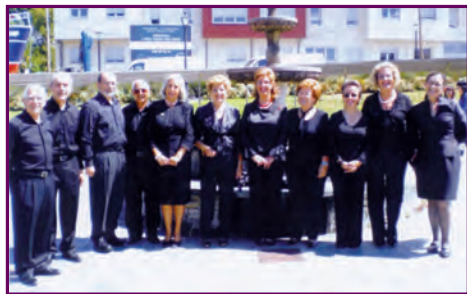
Schola Gregoriana Lucensis - Lugo