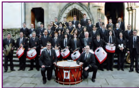
Banda Municipal de Guntín