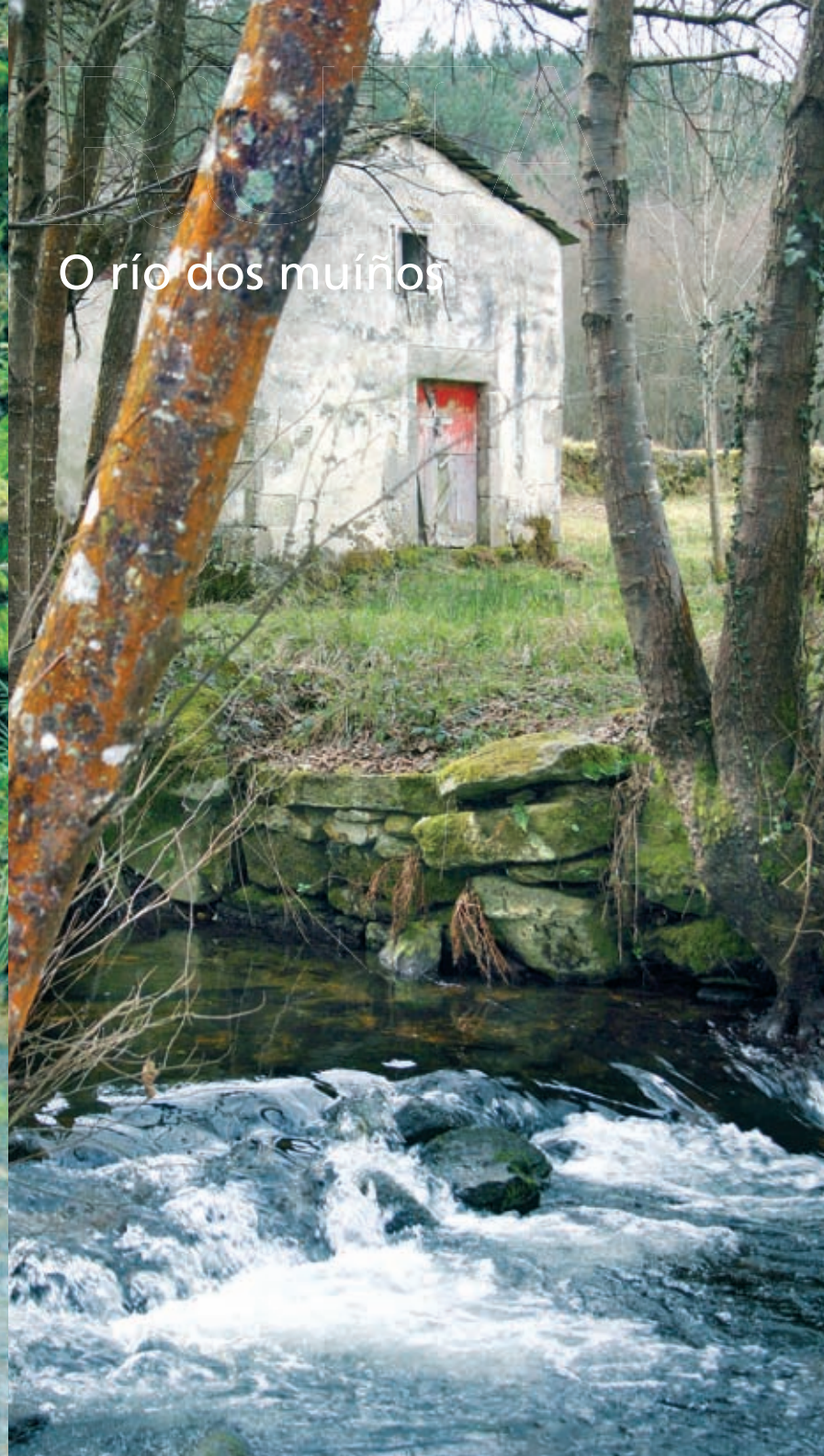
O río dos muíños