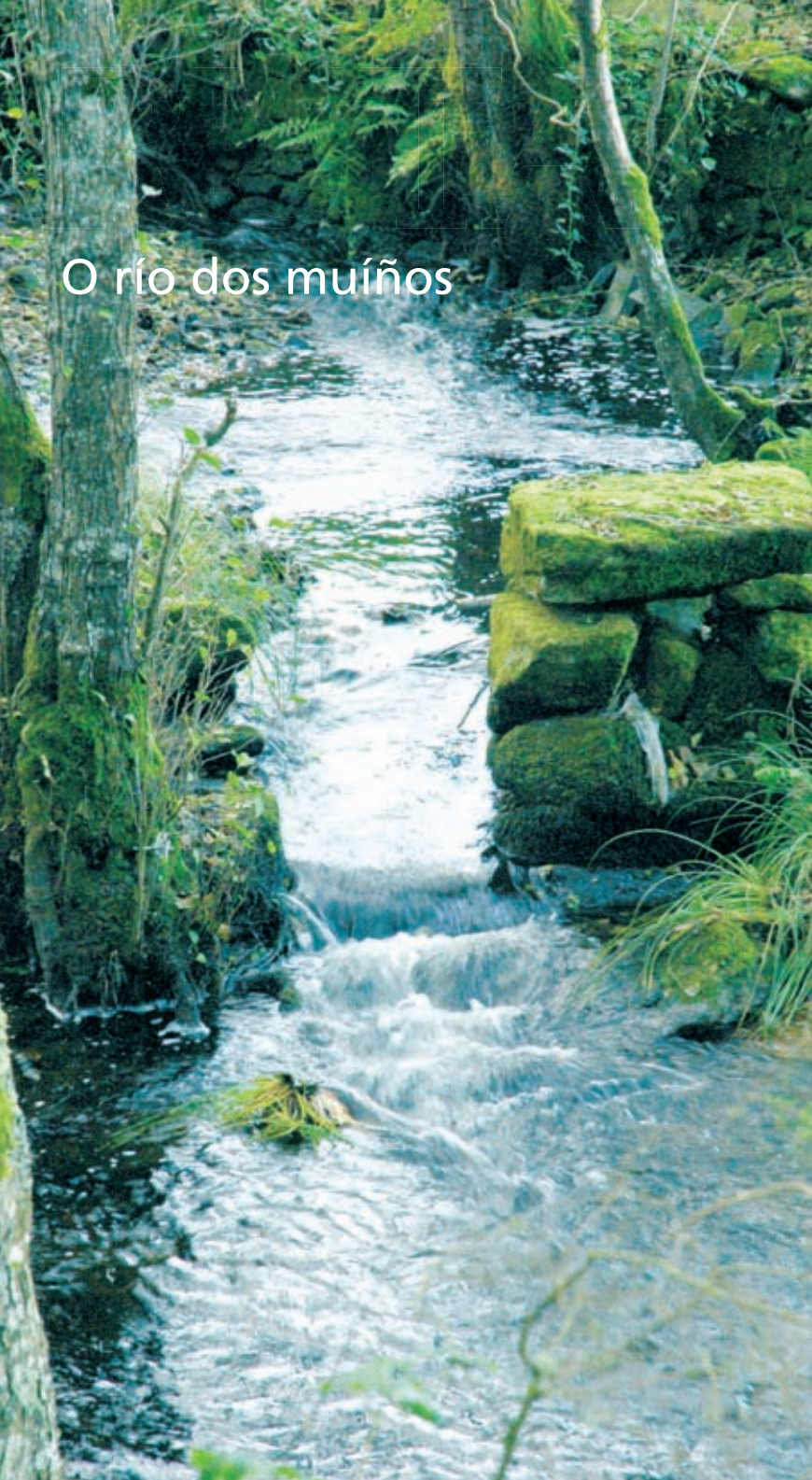
O río dos muíños